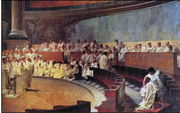
Cicero talar inför senaten