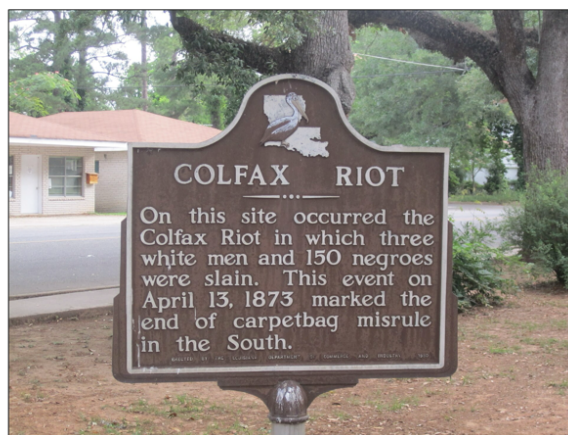
Omstridd skylt i Colfax som restes 1950 plockades ned 2021.

Colfaxmassakern den 13 april 1873 var den blodigaste enskilda våldshändelsen under Rekonstruktionen och ett avgörande ögonblick i kampen om politisk makt i Louisiana. Konflikten hade sin bakgrund i det omstridda guvernörsvalet 1872, där både demokraten John McEnery och republikanen William P. Kellogg utropade sig som segrare. På lokal nivå i Grant Parish skapade detta två parallella regeringar: en republikansk, stödd av svarta fria män (freedmen), och en demokratisk, stödd av vita konservativa.