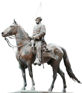
Nathan Bedford Forrest (staty i som tidigare stod i Memphis)