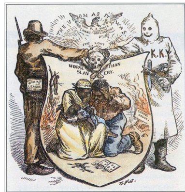
White league och KKK. Illustration från 1874.

Benjamin Ryan Tillman var en av de mest inflytelserika politikerna i South Carolina under perioden efter inbördeskriget, och hans karriär visar hur våld och politik vävdes samman i återupprättandet av vit överhöghet i Södern. Tillman föddes 1847 och trädde in i politiken i en tid då Rekonstruktionen försökte skapa en politisk ordning där både svarta och vita deltog. Han kom att bli en av de mest högljudda motståndarna till detta projekt och använde både retorik och direkt våld för att forma delstatens framtid.