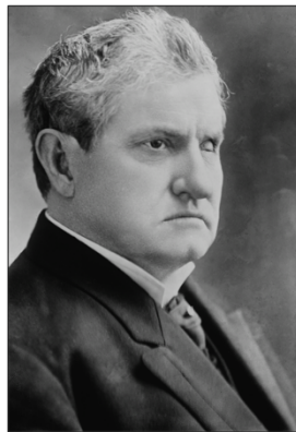
Benjamin Tillman (1847-1918)