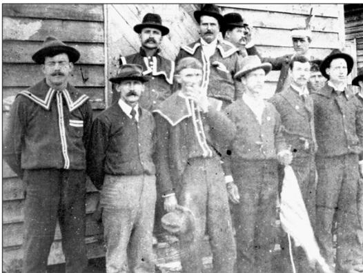
Bild från 1898 av en grupp medlemmar i Red Shirts.