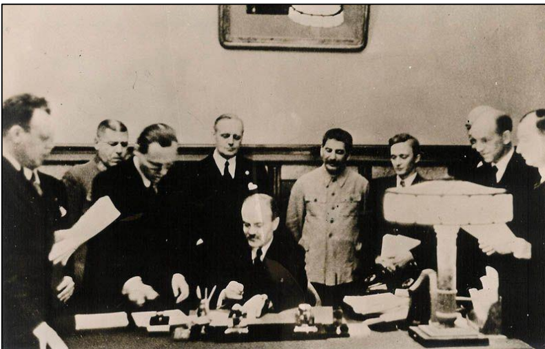
DN - framsida 24 augusti 1939