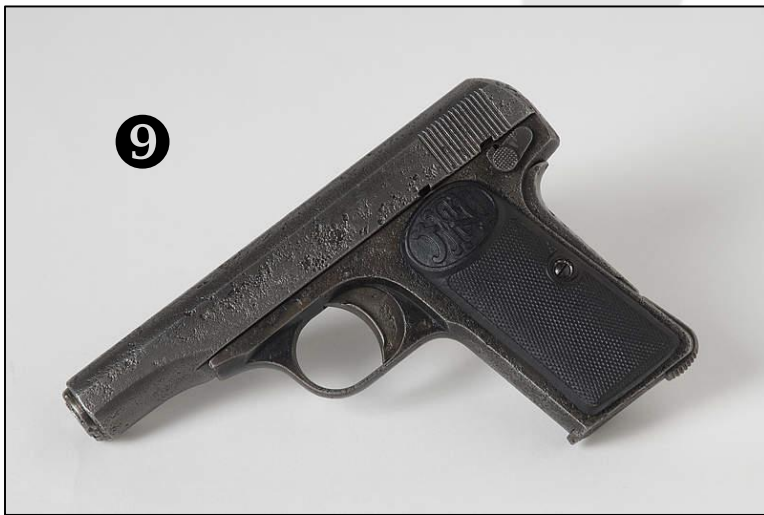
Källa 7: Gavrilo Princip's pistol. Pistolen finns på Wiens historiska militärmuseum.